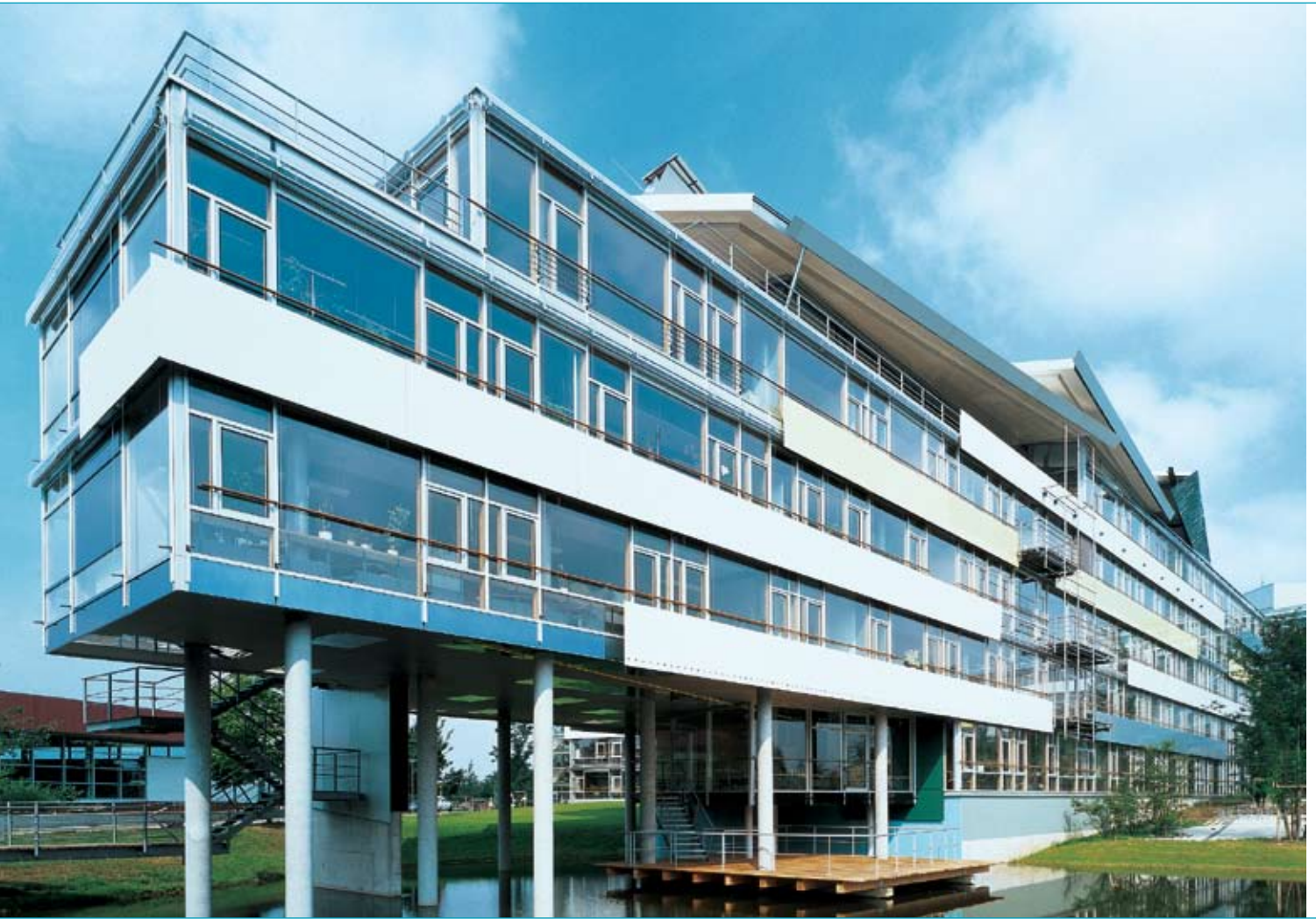
Im Gebäude der Landesversicherungsanstalt Lübeck zeigen ALLSTOP®-Gläser das Thema Sicherheit von seiner transparenten Seite.